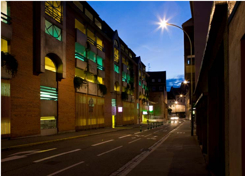
Austerlitz car park : a complete environment-friendly renovation