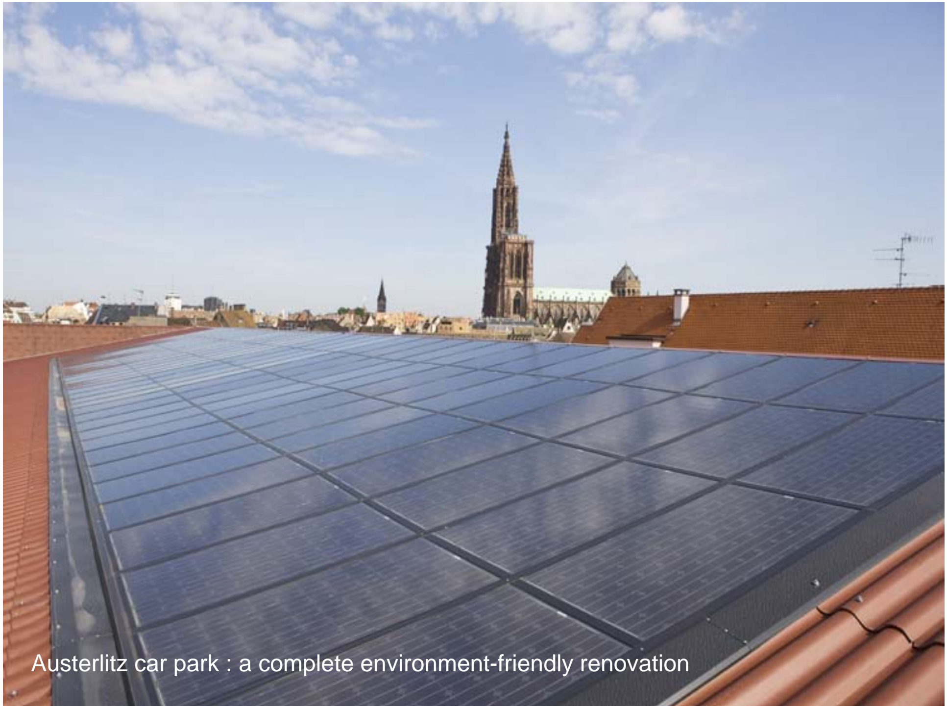
Austerlitz car park : a complete environment-friendly renovation