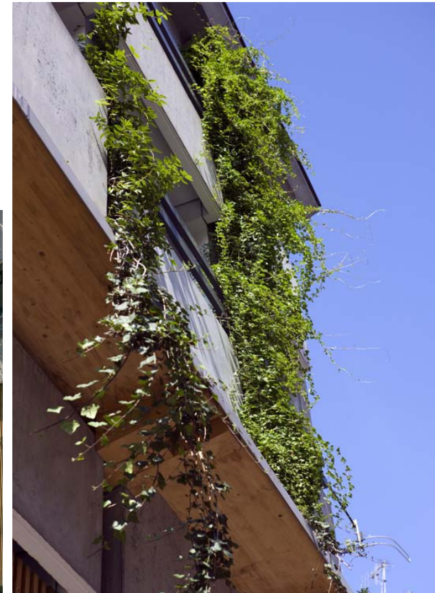
Austerlitz car park : a complete environment-friendly renovation