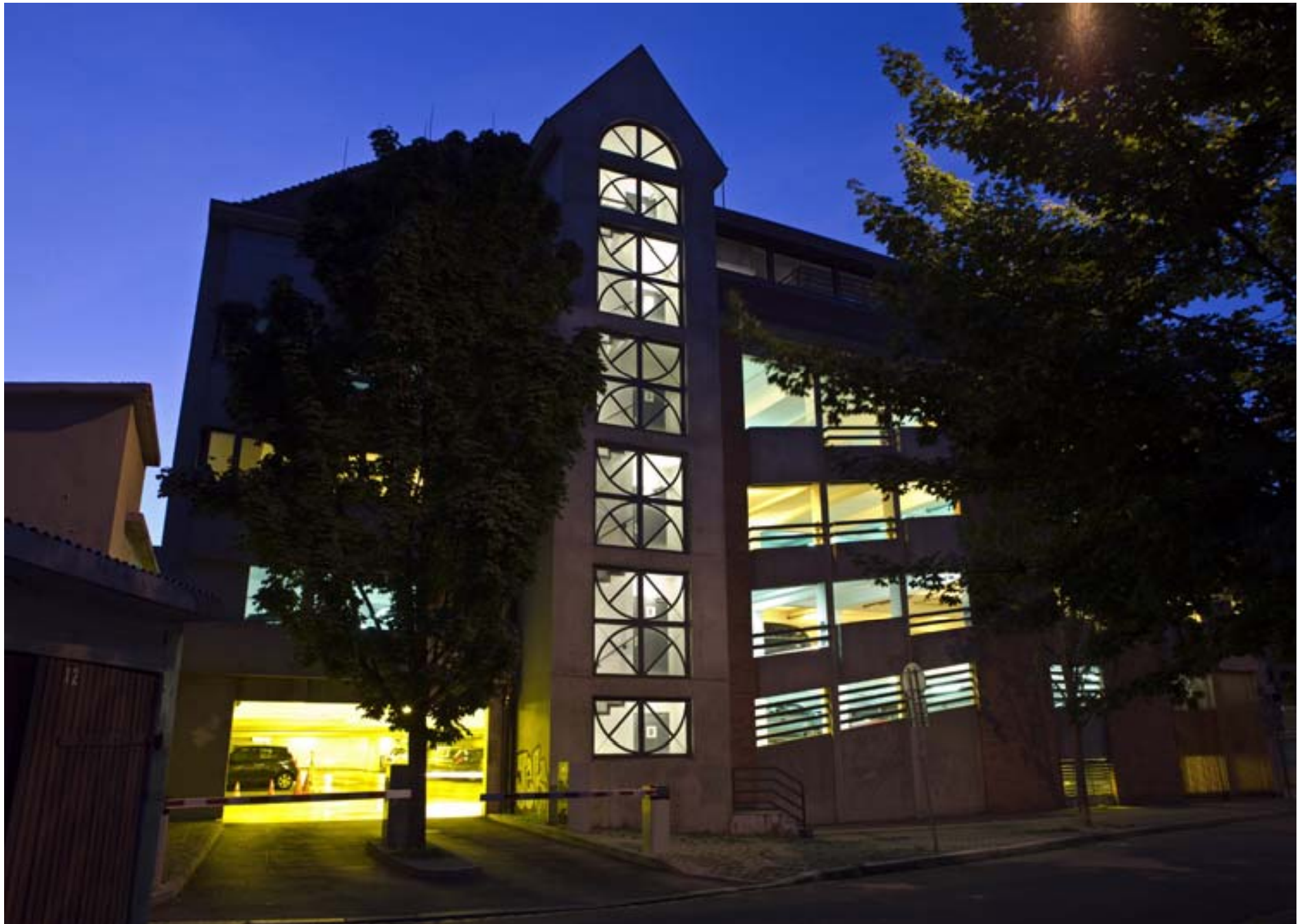
Austerlitz car park : a complete environment-friendly renovation