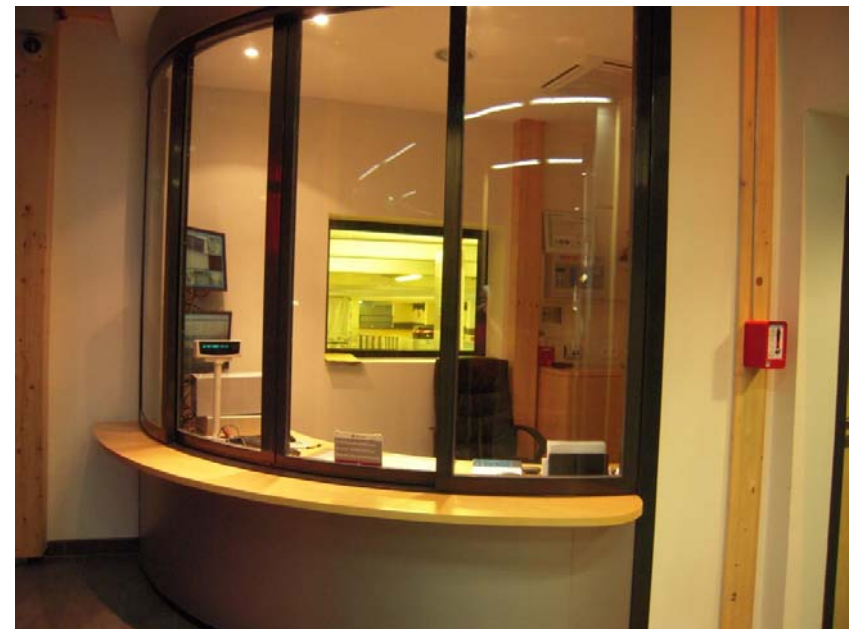
Austerlitz car park : a complete environment-friendly renovation