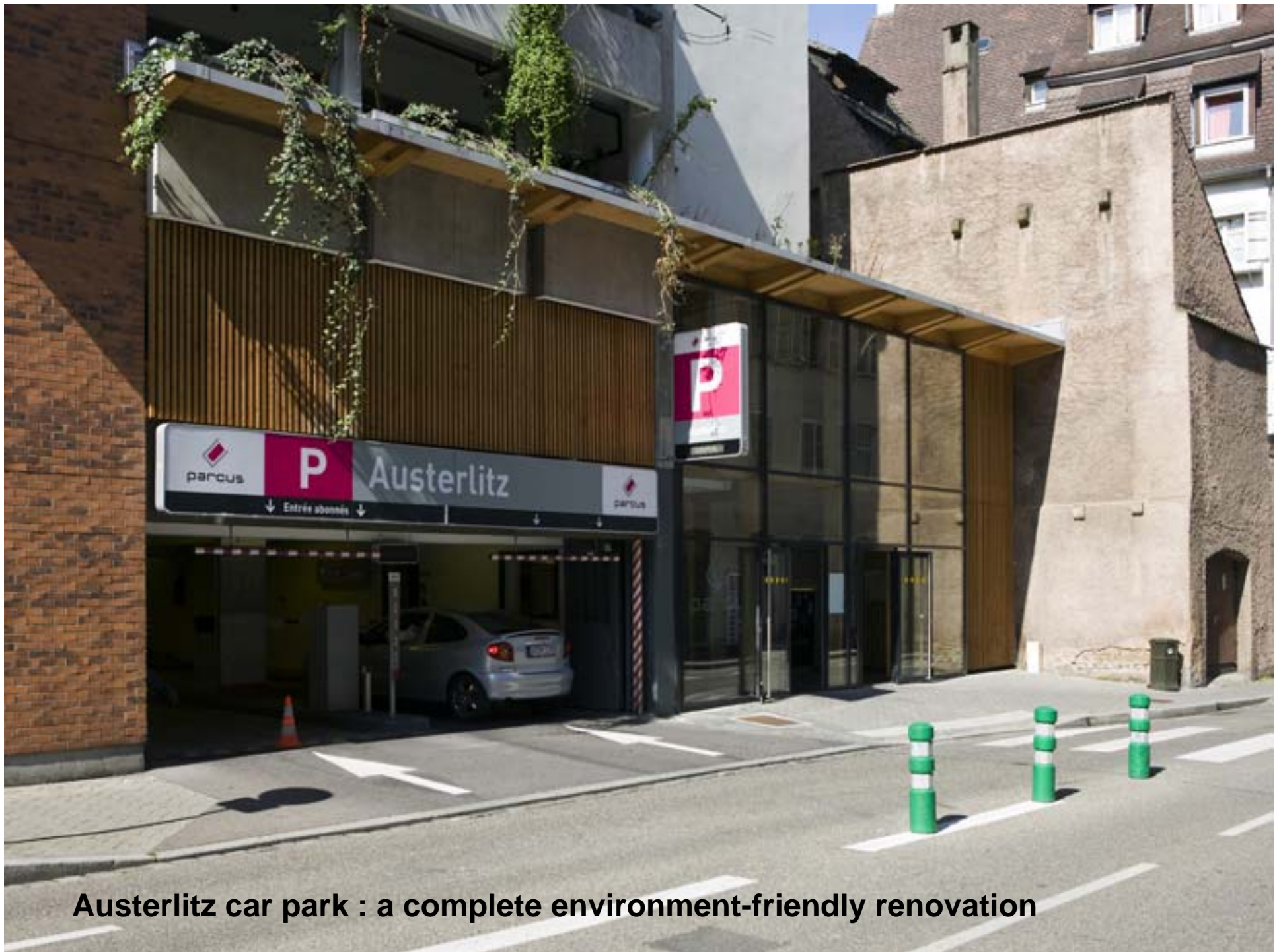
Austerlitz car park : a complete environment-friendly renovation