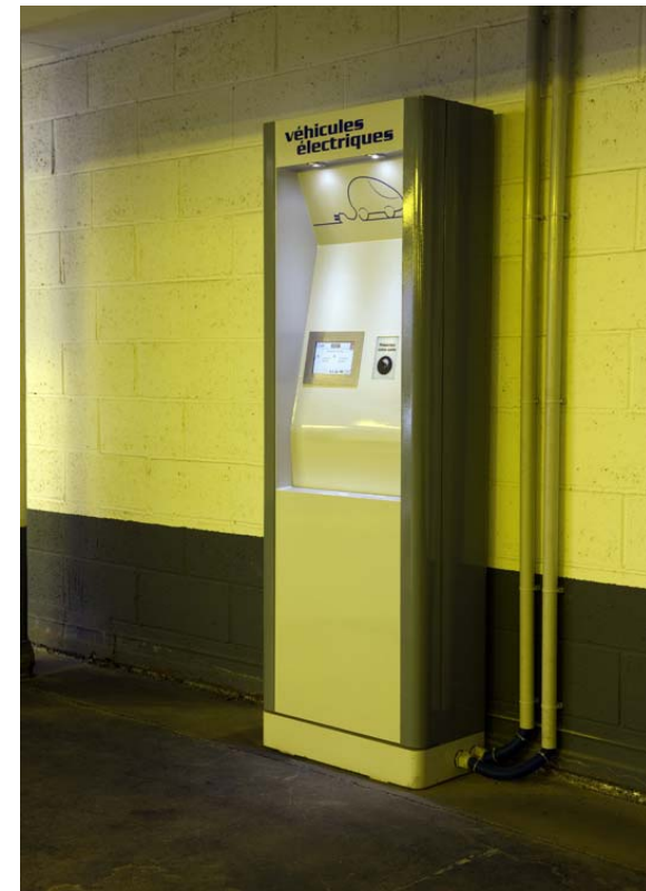
Austerlitz car park : a complete environment-friendly renovation